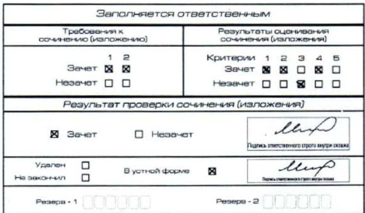
Рис. 12. Область для оценки работы сочинения (изложения) в устной форме

После окончания заполнения бланка регистрации ответственное лицо ставит свою подпись в специально отведенном для этого поле.