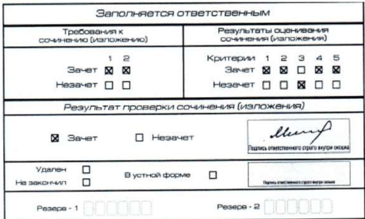
Рис. 11. Область для оценки работы